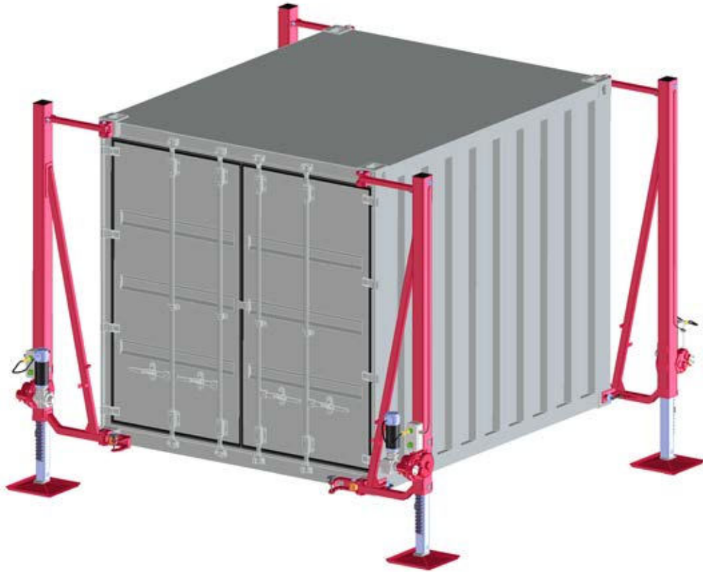
Abb. zeigt stirnseitig beischwenkbare Ausführung mit automatischer Nivellierung 24 V-DC / fig. shows version swiveling along short side with automatic levelling 24 V DC / fig. version pivotante frontale avec mise à niveau automatique, motorisation 4 x 24 V DC

Dispositif de levage 20 t pivotant, type 1889.20