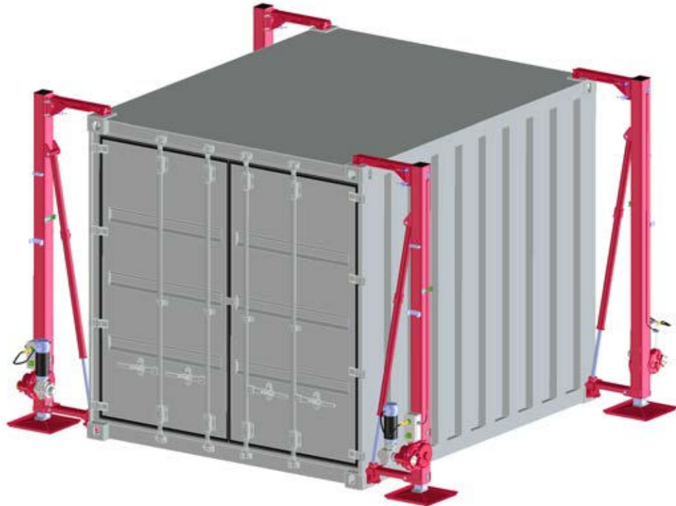
Abb. zeigt Ausführung mit automatischer Nivellierung 230 V AC / fig. shows option ‚Autolevelling 230 V AC‘ / fig. avec option « Mis à niveau automatique 230 V AC »

Dispositif de levage 20 t démontable, type 1889.20