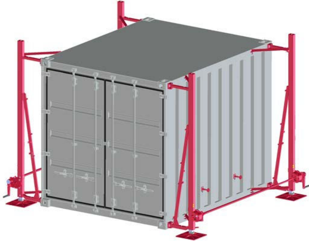
Abb. zeigt längsseits beischwenkbare Ausführung mit manuellem Antrieb / fig. shows swivelling version long side, manually operated / fig. version pivotant longitudinal, opération manuelle

Dispositif de levage 5 t pivotant, type 1889.5