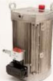
KA22: Elektrohydraulická pohonná jednotka 3fázová 400V/50Hz pro stroje A200 / A270 / A350