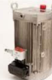
KA42: Elektrohydraulická pohonná jednotka 3fázová 400V/50Hz pro stroje A400 / A400RS / A500