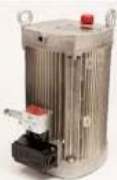
KAW22: Elektrohydraulická pohonná jednotka 1fázová 230V/50Hz pro stroje A200 / A270 / A350