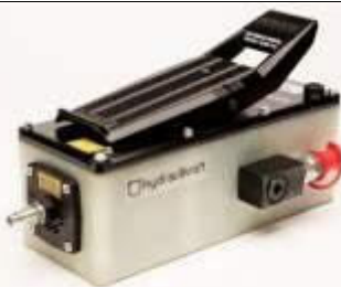
HKB6: Vzduchové/hydraulické čerpadlo pro stroje: A200 / A270 / A350 Spotřeba vzduchu ~250 l/min