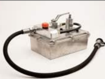
PUH-2: Jednotka hydraulického čerpadla pro pohon akumulátorovou vrtačkou pro stroje A100 / A200 / A270 / A350