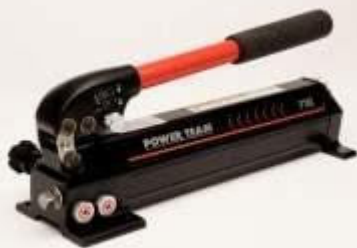
P19L: Pro model stroje A100