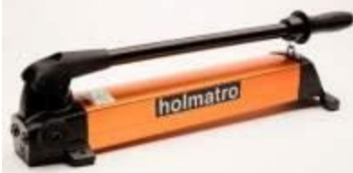
PA09H2: Pro model stroje A200 / A270