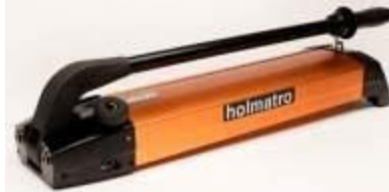
PA18H2: Pro model stroje A350